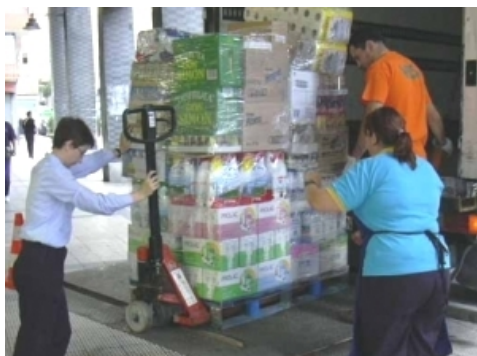
Proyecto de análisis y optimización

La Asociación Logística Innovadora de Aragón (ALIA) está desarrollando un proyecto de Análisis y Optimización de la Distribución Urbana de Mercancías en la ciudad de Zaragoza , basándose en la experiencia de otras ciudades europeas. Con este proyecto, ALIA pretende posicionar a Zaragoza como un referente en materia de distribución urbana de mercancías a nivel nacional y europeo.