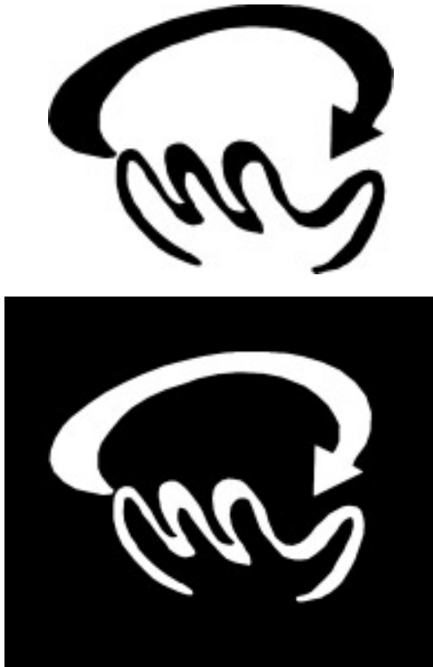
CUADRO 1 Versión (Blanco y negro y negativo)